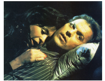
1986 TOUCH AND GO (Touch and Go) de Robert Mandel avec Maria Conchita Alonso