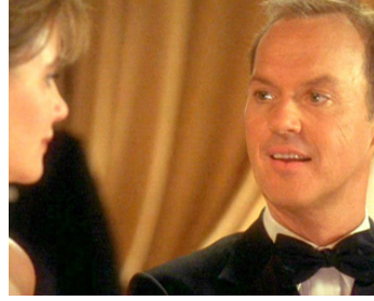
2000 UN BUT POUR LA GLOIRE (A Shot at Glory) de Michael Corrente avec Sheila Latimer