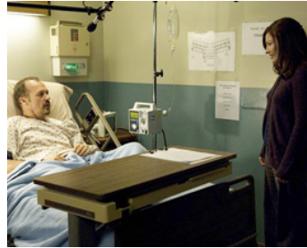
2008 KILLING GENTLEMAN (The Merry Gentleman) de Michael Keaton avec Kelly Macdonald