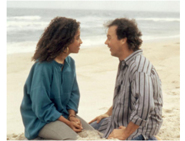
1987 MANHATTAN LOTO (The Squeeze) de Roger Young avec Rae Dawn Chong