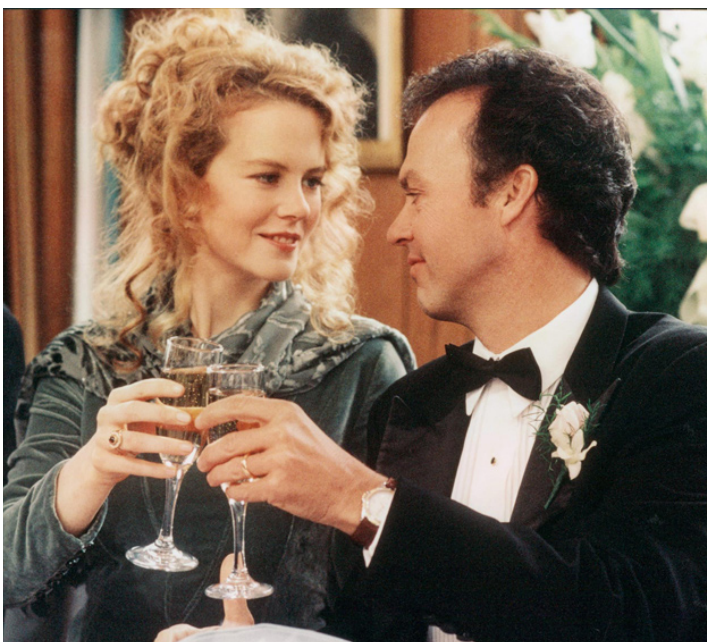
1993 MY LIFE (My Life) de Bruce Joel Rubin avec Nicole Kidman