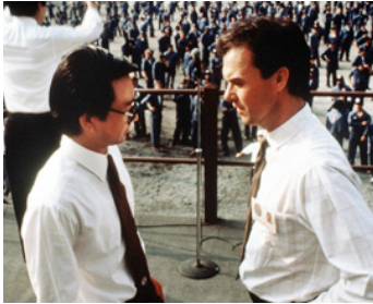
1986 GUNG HO, DU SAKÉ DANS LE MOTEUR (Gung Ho) de R. Howard avec Gedde Watanabe