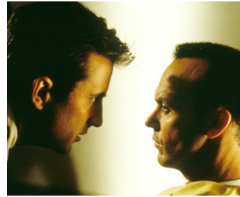
1998 L'ENJEU (Desperate Measures) de Barbet Schroeder avec Andy Garcia