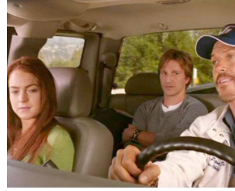
2005 LA COCCINELLE REVIENT (Herbie Fully Loaded) d'A. Robinson avec Lindsay Lohan