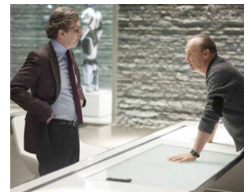
2014 ROBOCOP (RoboCop) de José Padilha avec Gary Oldman