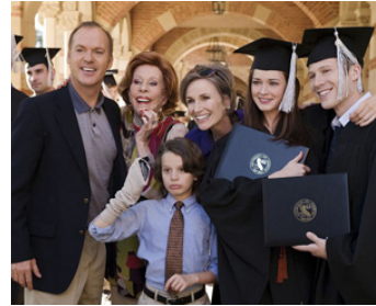
2009 POST GRAD (Post Grad) de Vicky Jensen avec Jane Lynch, Carol Burnett, Alexis Bedel