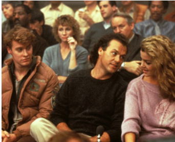
1988 RETOUR À LA VIE (Clean and Sober) de Glenn Gordon Caron avec Tate Donovan, Kathy Baker