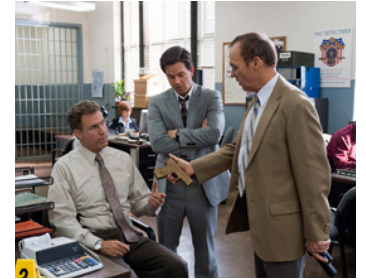
2010 VERY BAD COPS (The Other Guys) d'Adam McKay avec Will Ferrell, Mark Wahlberg