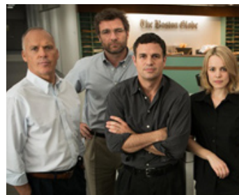
2015 SPOTLIGHT (Spotlight) de Thomas McCarthy avec L. Schreiber, M. Ruffalo, R. McAdams