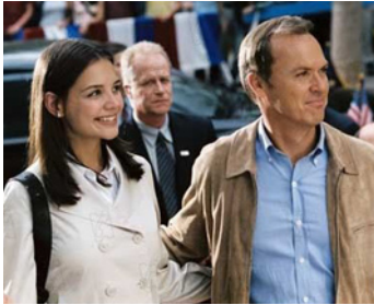
2004 DES ÉTOILES PLEINS LES YEUX (First Daughter) de F. Whitaker avec Katie Holmes