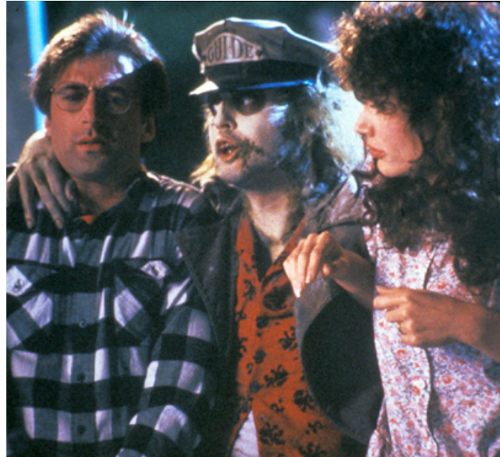
1988 BEETLEJUICE (Beetlejuice) de Tim Burton avec Geena Davis, Alec Baldwin