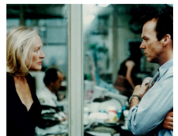
1994 LE JOURNAL (The Paper) de Ron Howard avec Glenn Close