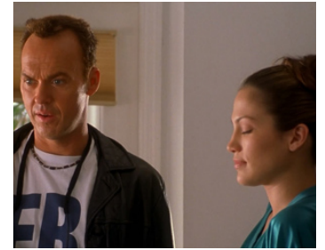
1998 HORS D'ATTEINTE (Out of Sight) de Steven Soderberg avec Jennifer Lopez