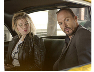
2005 GAME SIX (Game 6) de Michael Hoffman avec Ari Graynor