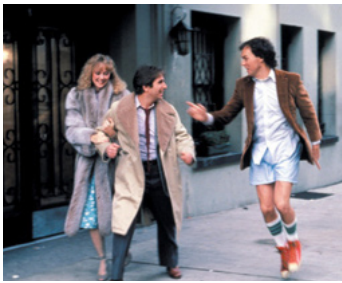
1982 LES CROQUE-MORTS EN FOLIE (Night Shift) de Ron Howard avec Shelley Long, H. Winkler