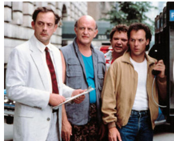
1989 UNE JOURNÉE DE FOUS (The Dream Team) de H. Zieff avec Ch. Lloyd, P. Boyle, S. Furst