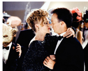
1992 BATMAN, LE DÉFI (Batman returns) de Tim Burton avec Michelle Pfeiffer