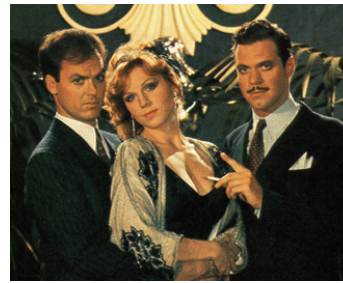
1984 JOHNNY LE DANGEREUX (Johnny Dangerous) d'A. Heckerling avec Marilu Henner, J. Piscopo