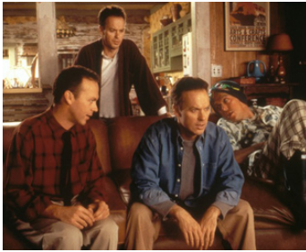
1996 MES DOUBLES, MA FEMME ET MOI (Multiplicity) de Harold Ramis