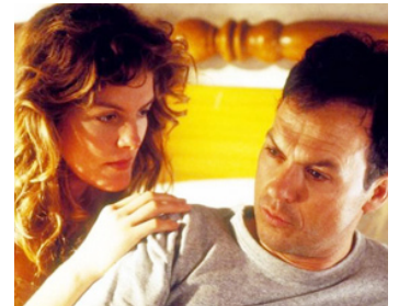
1991 UN BON FLIC (One Good Cop) de Heywood Gould avec Rene Russo