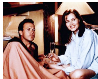
1994 CHÉRIE, VOTE POUR MOI (Speechless) de Ron Underwood avec Geena Davis