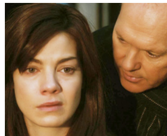
2013 PENTHOUSE NORTH (Penthouse North) de Joseph Ruben avec Michelle Monaghan