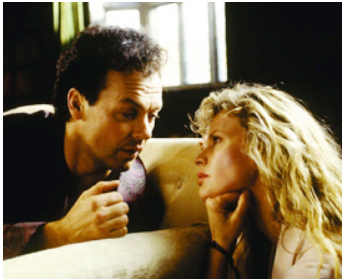
1989 BATMAN (Batman) de Tim Burton avec Kim Basinger