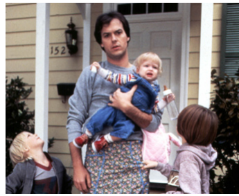
1983 MISTER MOM (Mister Mom) de Stan Dragoti