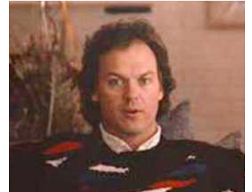
1988 LA VIE EN PLUS (She's Having a Baby) de John Hughes