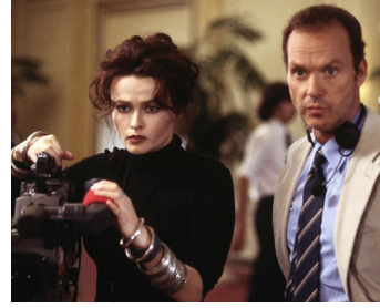
2002 EN DIRECT DE BAGDAD (Life from Baghdad) de Mick Jackson avec Helena Bonham-Cater