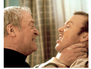
2003 UN TUEUR AUX TROUSSES (Quicksand) de John Mackenzie avec Michael Caine