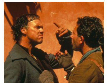
1993 BEAUCOUP DE BRUIT POUR RIEN (Much Ado about Nothing) de Kenneth Branagh