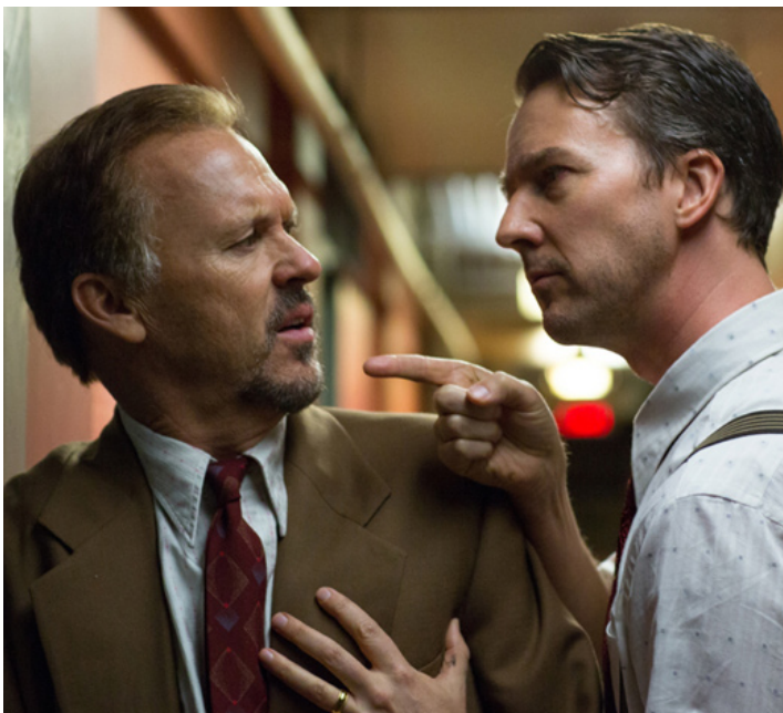
2014 BIRDMAN (Birdman) d'Alejandro Gonzalez Iñárritu avec Edward Norton