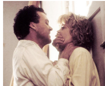
1990 FENÊTRE SUR PACIFIQUE (Pacific Heights) de John Schlesinger avec Melanie Griffith