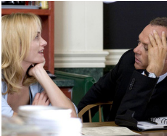
2006 THE LAST TIME (The Last Time) de Michael Calero avec Amber Valletta