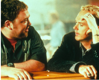
1998 JACK FROST (Jack Frost) de Troy Miller avec Mark Addy