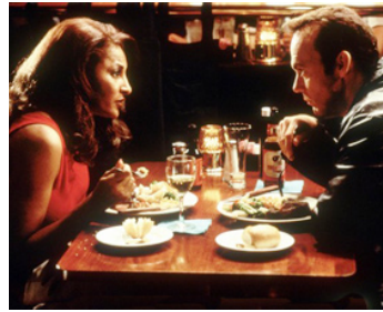
1997 JACKIE BROWN (Jackie Brown) de Quentin Tarantino avec Pam Grier